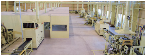
光触媒・ハードコート塗装ライン(第8工場)