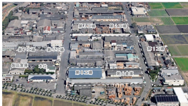
工場全景・敷地面積 11,000 坪

ヒノキ(九州) ケヤキ(九州・関東) 杉(九州) 松(九州) チーク(インドネシア) ナラ(中国) サクラ(中国) クリ(中国) ウォールナット(米国)